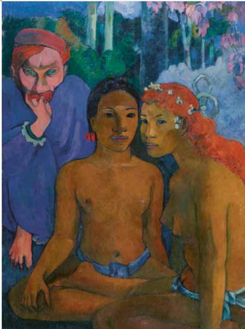
Paul Gauguin, Contes barbares, 1902

Der Folkwang-Museumsverein ist bis heute Miteigentümer der Sammlung und gemeinsam mit der Stadt wichtige Stütze der Institution. Der Vertrag zwischen Stadt und Verein von 1922 begründet eine der ältesten Public-private-Partnerships in Deutschland. Er besteht nahezu unverändert fort und bildet die Grundlage der erfreulichen Zusammenarbeit sowie des großen Erfolgs des Museum Folkwang.