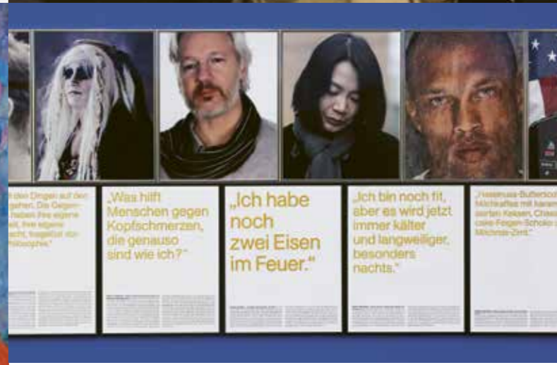
Sven Johne, Detailsicht Anomalien des frühen 21. Jahrhunderts / Einige Fallbeispiele, 2015 – 17